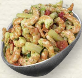
Garnelen-Spargel-Salat knackig-zarte Garnelen und feiner Spargel, raffiniert abgeschmeckt mit Bärlauchpesto, Lauchzwiebeln und Pinienkernen, 100 g