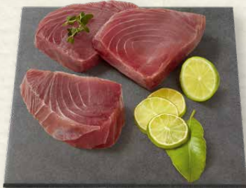
Thunfisch-Steaks das beste Stück vom Thunfisch, ideal zum Grillen und Braten, 100 g