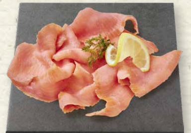
Räucherlachs geschnitten typisches Raucharoma, 100 g