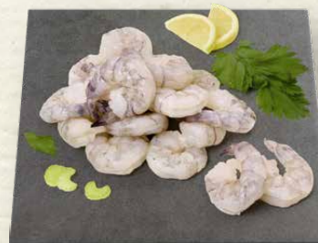
Riesengarnelenschwänze 13 / 15 Seawater Garnelen roh, ohne Kopf und ohne Schale, zum Verkauf aufgetaut, 100 g