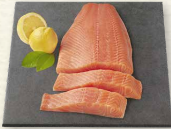
Lachsfilet mit Haut aus Aquakultur