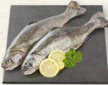
Regenbogenforellen ausgenommen, küchenfertig, aus Aquakultur