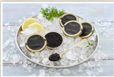
„Black Adamas“ Kaviar Kaviar vom sibirischen Stör aus Voralpen-Frischwasseraufzucht, 30 g Dose