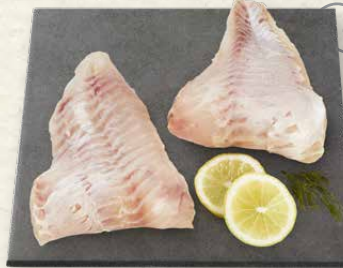
MSC Isländische Rotbarschfilets festes Fleisch, ein leichter und frischer Genuss, gefangen im Nordostatlantik, 100 g