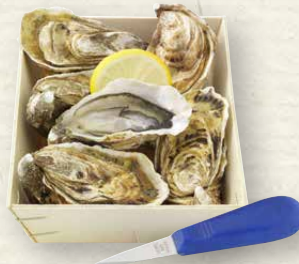
Austern „Fines de Claire“ 6 delikate Fines-de-Claire-Austern, mit passendem Austermesser, Box