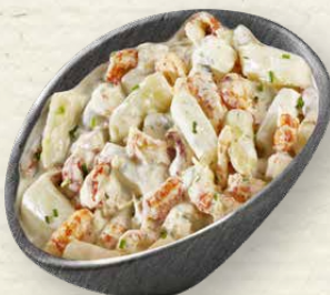
Flusskrebs-Spargelsalat Louisiana-Flusskrebschwänze im Zusammenspiel mit zartem Spargel und fruchtig-süßem Mango, in einem cremigen Dressing mit Sahne und Frischkäse