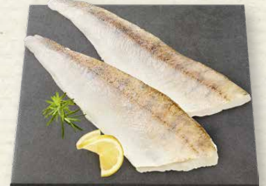
Zanderfilets mit Haut, festes, zartes Fleisch mit angenehm dezentem Geschmack, zum Verkauf aufgetaut, 100 g