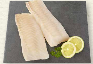
MSC Kabeljaurückenfilets ohne Haut, 100 g