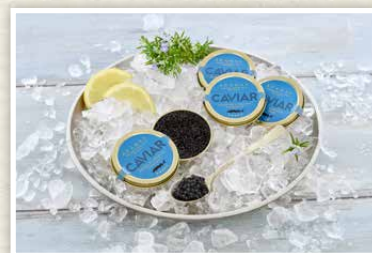
„Aqua Adamas“ Kaviar Kaviar vom adriatisch-sibirischen Stör aus Voralpen-Frischwasseraufzucht, 30 g Dose